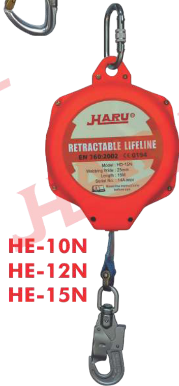
HE-10N HE-12N HE-15N